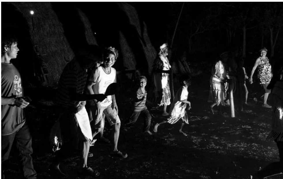
Foto 9 – Crianças no ritual. Acampamento Laranjeira Ñanderú, 19 de abril de 2014.

As imagens 8 e 9 se referem aos rituais Guarani e Kaiowá. Esses rituais, segundo Mura (S.D.), são importantes para a organização do grupo indígenas por integrá-los. Dentre os ritos, alguns são destacados: