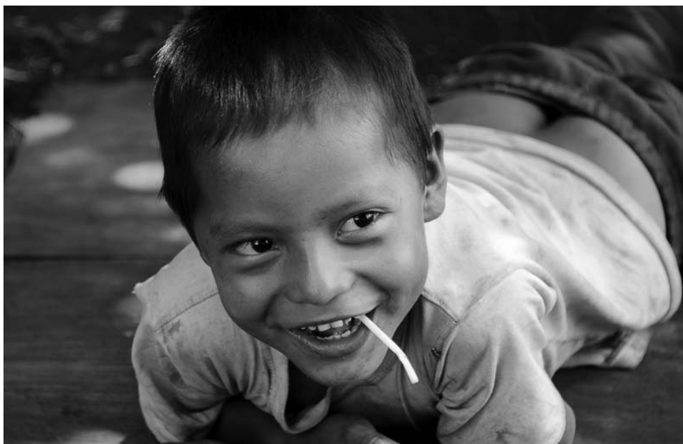
Foto 6 – Um pirulito e um sorriso. Acampamento Pakurity, 5 de março de 2014.