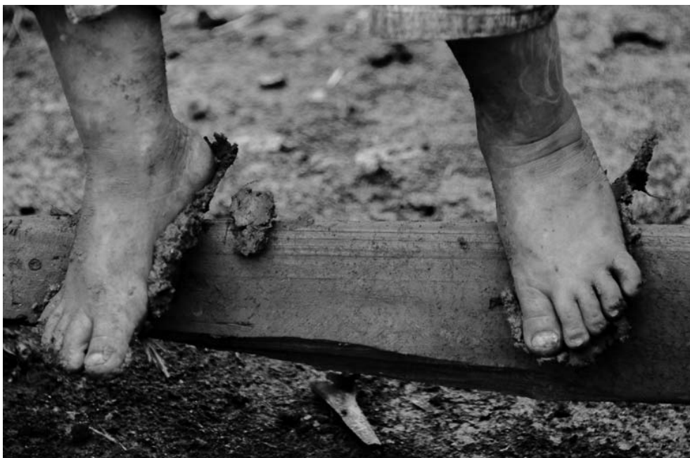
Foto 7 – O barro nos pés. Acampamento Curral do Arame, 19 de abril de 2014.

As imagens números 5, 6 e 7 compõem uma série, com um tema comum: o lazer, a recreação, o ser criança. O brincar está presente no cotidiano, mesmo sendo essas crianças privadas de direitos básicos.