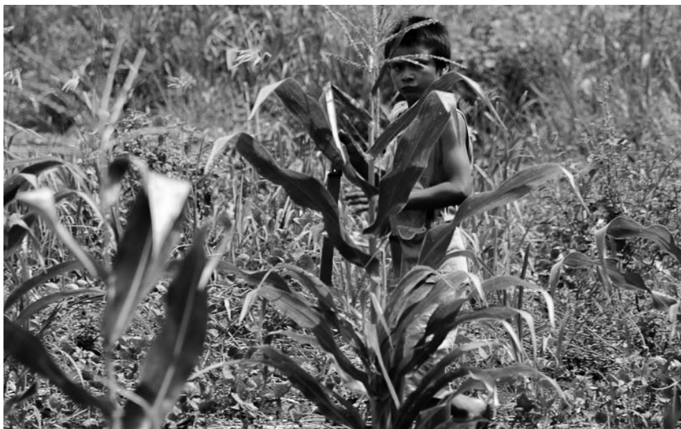
Foto 10 – Criança no trabalho duro. Acampamento Curral do Arame, 5 de março de 2014.

O assentamento Laranjeira Ñanderu, apesar de ser privado também de direitos básicos como saneamento, energia e coleta de lixo, possui um espaço maior de terra e mata, proporcionando aos indígenas maior interação com ela, e assim, com sua forma de viver, pois, na cultura Kaiowá e Guarani, a terra não possui donos, não pertence a ninguém, assim, são os indígenas que pertencem a terra, segundo Mura (2004).