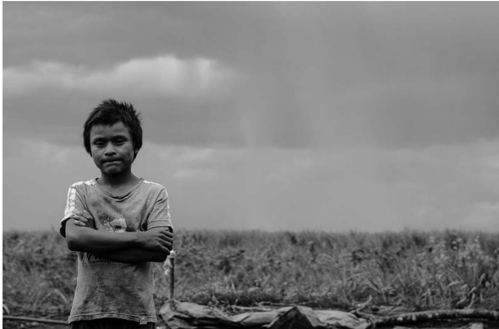
Foto 11 – Um futuro incerto. Acampamento Curral do Arame, 5 de março de 2014.

Sintetizo minhas conclusões na forma proposta desta pesquisa para reflexão frente ao descaso do poder público e a omissão tão comum entre boa parte sociedade civil.