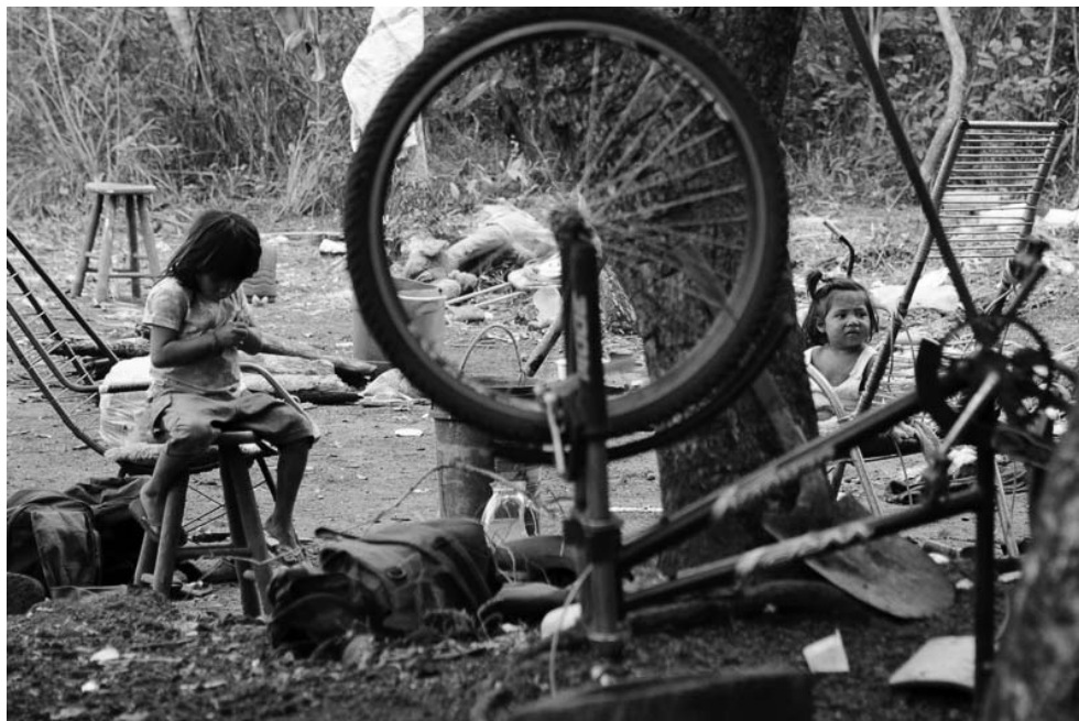
Foto 2 – Crianças em seu local de moradia. Acampamento Laranjeira Ñanderu, 18 de abril de 2014.

ção das terras tradicionais e assim viver em paz na terra que já pertenceu aos seus ancestrais, mesmo possuindo tão pouca esperança diante de um futuro incerto e árduo para os indígenas do estado.