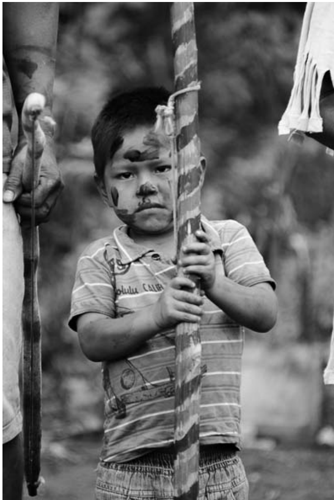
Foto 8 – O pequeno guerreiro. Acampamento Curral do Arame, 5 de março de 2014.