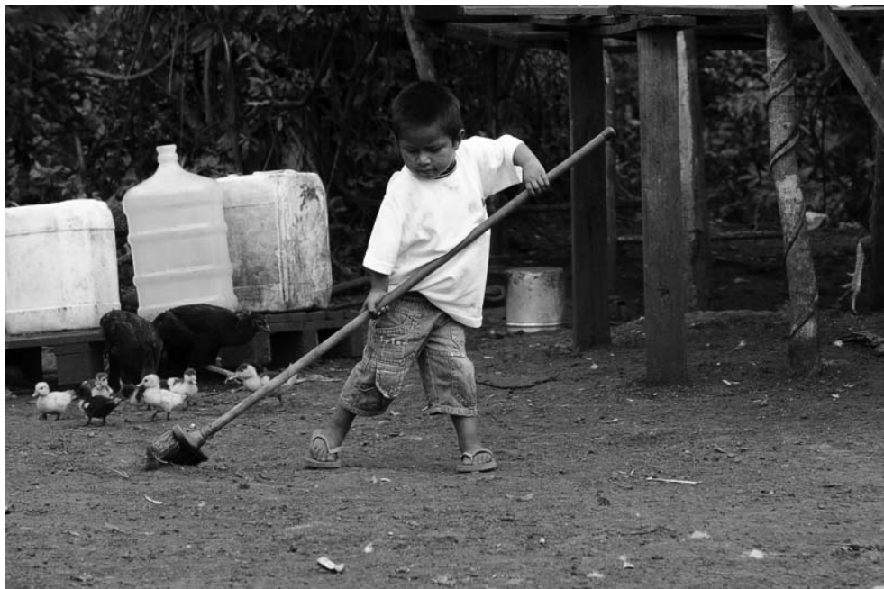
Foto 3 – O compromisso com afazeres cotidianos. Acampamento Curral do Arame, 5 de março de 2014.

A imagem 3 mostra que as crianças participam da rotina de trabalho doméstico do acampamento, desenvolvendo a responsabilidade individual para o benefício coletivo. Essa prática para os indígenas se diferem da cultura ocidental, e esse auxílio no trabalho doméstico não é considerado trabalho infantil. As atividades, de forma comum, acabam se tornando a distração dessas crianças, devido ao espaço exíguo que o acampamento oferece. Note que esse espaço destoa da imagem número 2, onde o lixo é abundante; isso se dá devido ao fato de que, nesse acampamento, a ocupação dos adultos é a lavoura e não a reciclagem como em Laranjeira Ñanderú. Vale explicitar que as crianças pertencentes a esse acampamento (Curral do Arame), apesar de este estar próximo da cidade de Dourados, não possuem acesso à escola, diferente do acampamento Laranjeira Ñanderu.