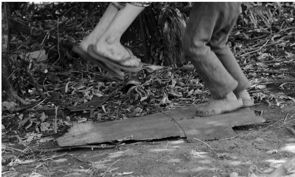
Foto 5 – Um pulo-pula improvisado. Acampamento Pakurity, 18 de abril de 2014.

possuem nenhuma iluminação elétrica, de forma que improvisam algumas lâmpadas movidas a baterias de automóveis ou fogueiras.