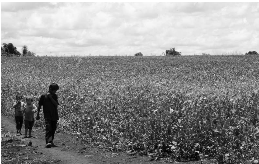
Foto 1 – Monocultura de milho. Acampamento Curral do Arame, 22 de janeiro de 2014.

A imagem acima retrata a disparidade entre o espaço que restou aos indígenas e aquele dominado pela monocultura nas terras que reivindicam. Percebe-se um caminho de chão batido à beira de uma plantação de milharal. Esse caminho liga os barracos onde vivem os indígenas e delimita o espaço a que possuem acesso, onde de um lado está a monocultura e do outro uma estreita faixa de mata ciliar. O lado da monocultura, embora extenso e abundante, os acampados não podem ocupar, nem mesmo colher do farto milho. No outro lado, onde existe a pequena faixa de mata ciliar, é onde os indígenas tentam criar animais para consumo, como galinhas e patos, e onde podem retirar a única água disponível, que brota da terra formando um pequeno e barroso córrego. A cerca de 200 metros dali, passa a rodovia BR-463, que, mesmo sendo próxima ao assentamento, não tem disponibilizado um meio de transporte que possa levar e trazer as crianças para escola mais próxima, no município de Dourados, MS.