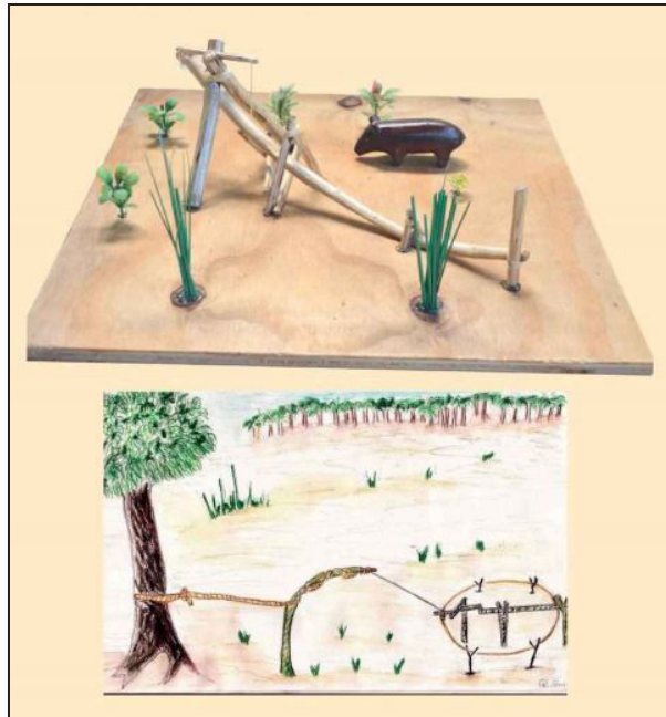
Figura 3 – Maquete com instrumentos de caça