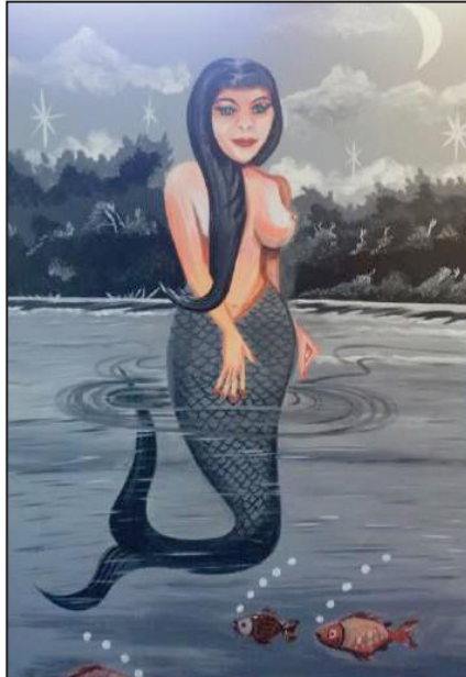
Figura 6 – Mãe dos peixes