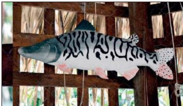
Figura 4 – Tsure-Surubin