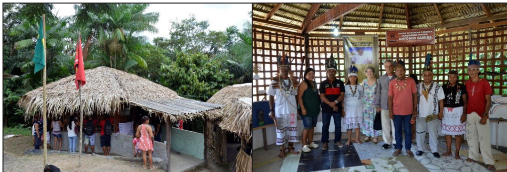
Figura 1 – CCS e Museu Vivo

na Estrada do Brasileirinho, km 8, ramal 08, rua Mutsana, n. 161, Puraquequara II da Comunidade Nova Esperança Kokama, Manaus (AM).