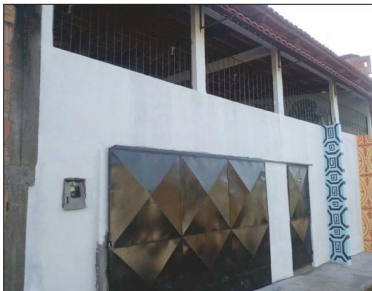
Figura 5 – CCS e Museu Vivo Lua Verde