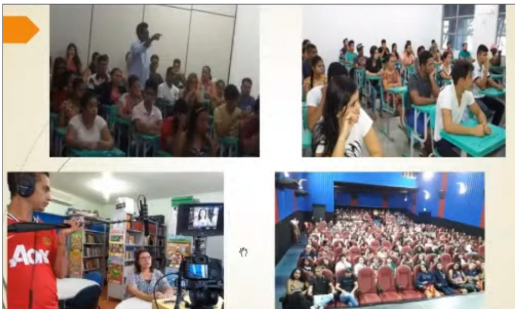
Figura 4 - Documentário apresentado aos estudantes